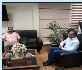
دیدار با نماینده منطقه ای همراه اول پیرامون پروژه های استانی