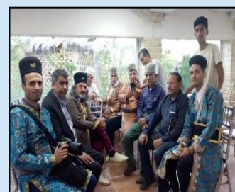
شرکت در مراسم روز ملی روستا و عشایر و حضور در میز خدمت این مراسم