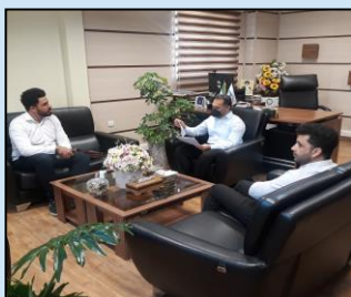
دیدار با مدیرعامل شرکت "پارس فیدانیتا" فعال در حوزه مدیریت سبز و مصرف بهینه انرژی