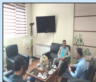
بررسی وضعیت ارتباطی شهرستان اوز در جلسه با فرماندار این شهرستان