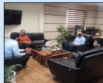
ملاقات و تکریم ارباب رجوع