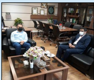
دیدار با نماینده امور ایثارگران واحدهای تابعه وزارت در استان فارس