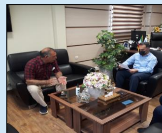
دیدار با اعضای شورای شهر پاسارگاد