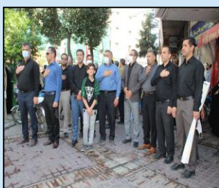
حضور مدیران و کارکنان واحدهای تابعه وزارت در استان فارس در راهپیمایی مردم شیراز جهت محکومیت اغتشاشگران