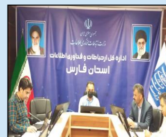
جلسه شورای راهبری توسعه ارتباطات و فناوری اطلاعات استان فارس