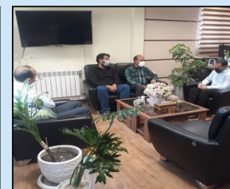
دیدار با دهیار روستاهای آرندی از توابع شهرستان شیراز و بادبر از توابع شهرستان بوانات در خصوص وضعیت ارتباطی این روستاها